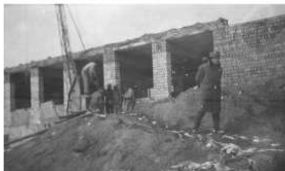
výstavba novej školy na prelome päťdesiatych a šesťdesiatych rokov