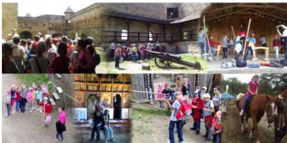
výlet Stará Ľubovňa (šk. rok 2011/2012)