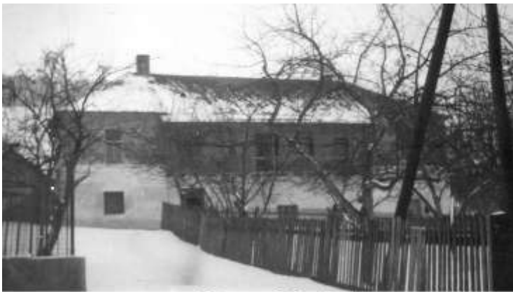
prvá budova školy (1950)