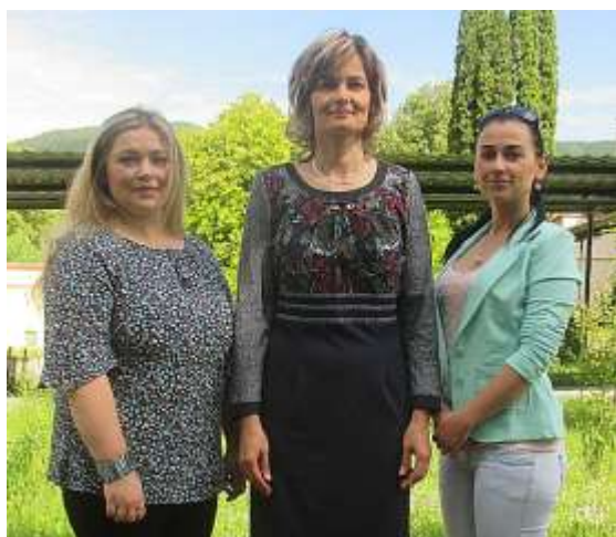
Kolektív zamestnancov MŠ s riaditeľkou školy