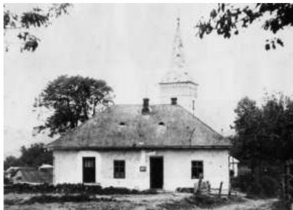
stará budova školy (1956)

V šk. roku 1956/1957 zaznamenala škola odchod žiakov – žiaci zo Štefanoviec znovu začali chodiť do školy do Hermanoviec, lebo sa zmenil školský obvod.