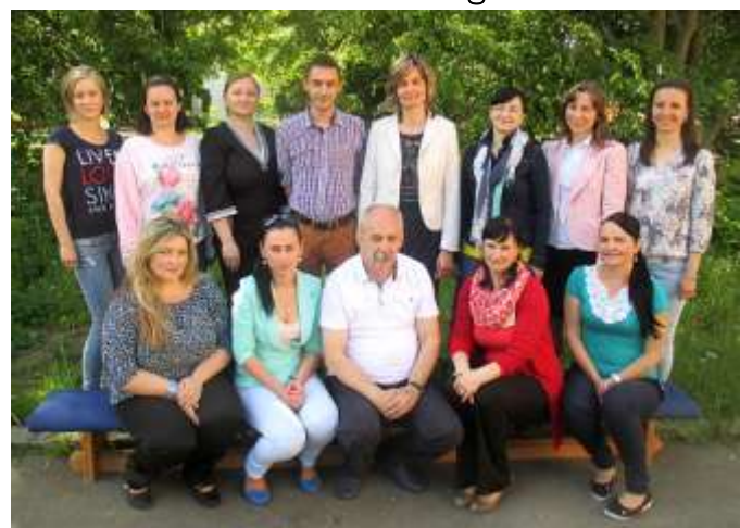
Kolektív pedagogických zamestnancov školy