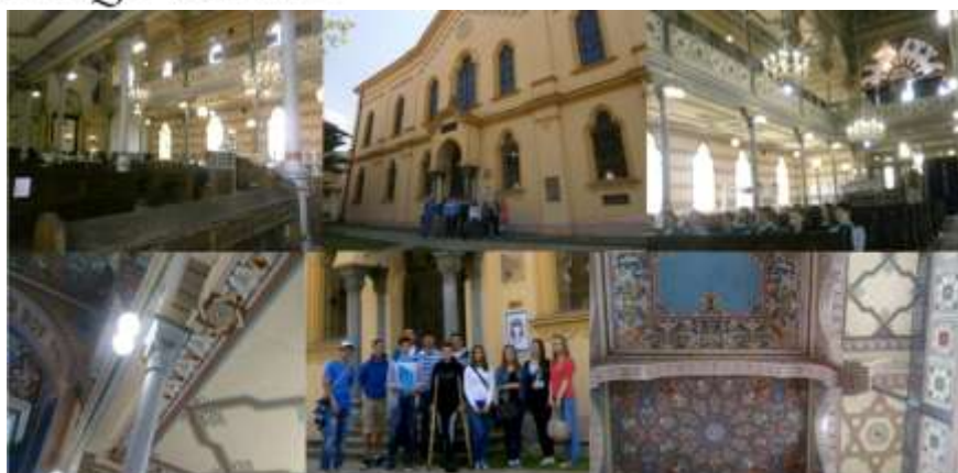
exkurzia v prešovskej synagóge