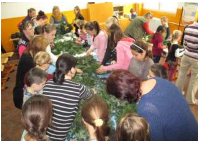
tvorba adventných vencov

Najväčším a aj najpopulárnejším podujatím, ktoré škola pravidelne usporadúva, je vianočná akadémia. Žiaci sa predstavujú svojimi hudobnými a tanečnými číslami a v scénkach vyzdvihujú hodnoty, na ktoré sa v dnešnom pretechnizovanom a skomercializovanom svete často zabúda.