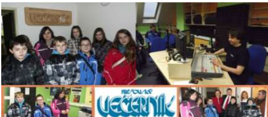
exkurzia v prešovskom Večerníku a rádiu

Na obohatenie a zatriktívnenie vyučovacieho procesu pravidelne podnikáme zaujímavé exkurzie a výlety, na ktorých spoznávajú naši žiaci nielen historické, kultúrne a prírodné krásy Slovenska, ale aj zaujímavosti zahraničia.