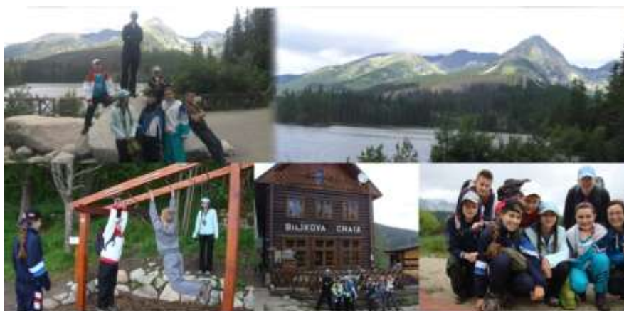
výlet Vysoké Tatry (šk. rok 2011/2012)