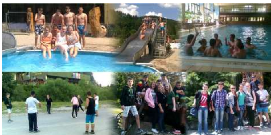
výlet Drienica (šk. rok 2013/2014)