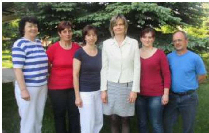
Kolektív nepedagogických zamestnancov školy s riaditeľkou školy