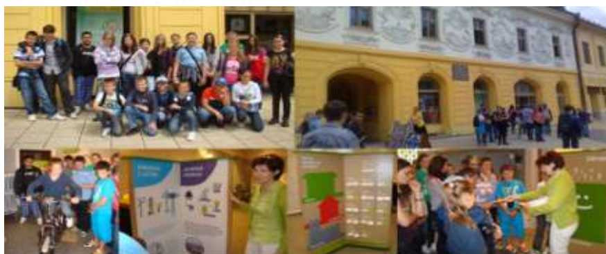
návšteva Múzea v Spišskej Novej Vsi spojená s výstavou Energia 3. tisícročia