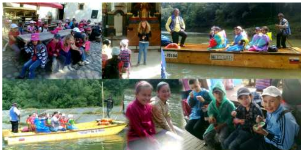
výlet Červený Kláštor (šk. rok 2013/2014)