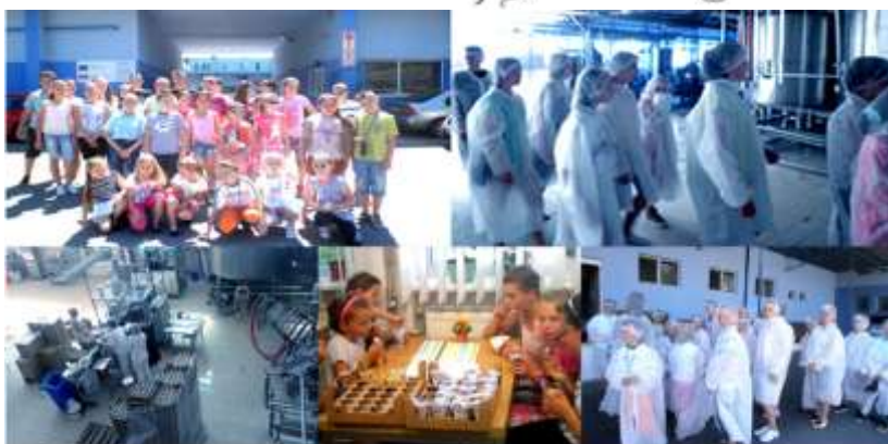
exkurzia vo výrobnom závode Milk Agro (Sabinov)