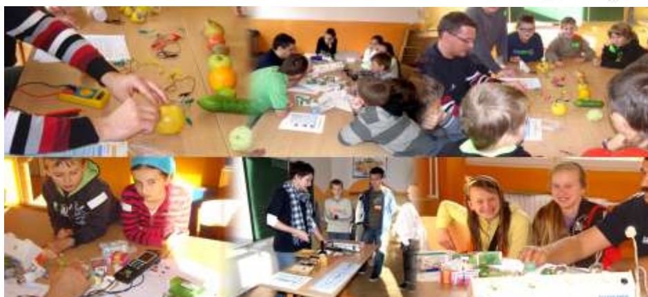
Deň otvorených dverí na tému „Žiť energiou“